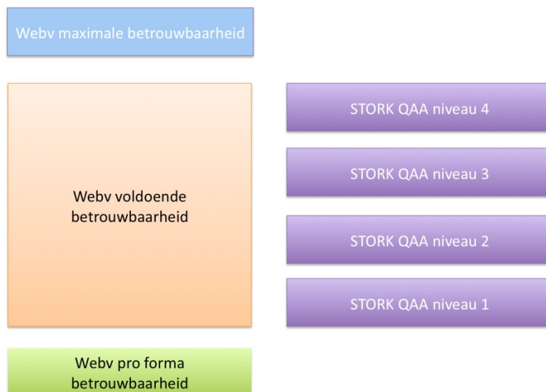
Figuur 4 Relatie open norm Awb en betrouwbaarheidsniveaus STORK

Ondanks de samenhang in de normen voor betrouwbaarheid op nationaal en EU-niveau, is in algemene zin moeilijk te zeggen wanneer in de praktijk sprake is van een voldoende mate van betrouwbaarheid en vertrouwelijkheid. De hoofdregel is dat aard en inhoud van een bericht en het doel waarvoor het wordt gebruikt, bepalend zijn voor de mate van betrouwbaarheid en vertrouwelijkheid die vereist is. Hier dient steeds een vergelijking gemaakt te worden met het conventionele, papieren verkeer: de mate van betrouwbaarheid en vertrouwelijkheid dient even groot te zijn als in het conventionele verkeer. Aan de verlening van een vergunning dienen bijvoorbeeld hogere eisen te worden gesteld dan aan het verstrekken van algemene informatie. 23 Praktisch gezien betekent een en ander dat de norm van een betrouwbare en vertrouwelijke communicatie uitwerking zal moeten vinden in het beleid van het desbetreffende bestuursorgaan. In bijlage 3 zijn voorbeelden gegeven van de wijze waarop vereisten in het conventionele (papieren) verkeer zich vertalen naar de elektronische situatie.