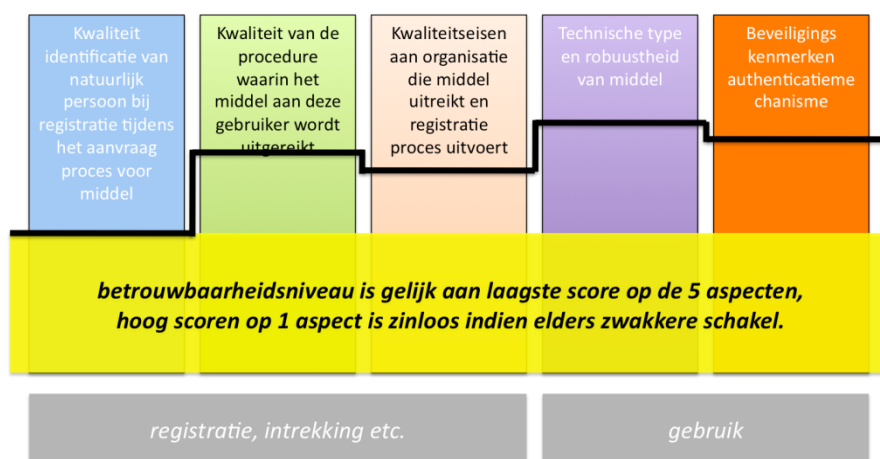
Figuur 3 Bepaling van het betrouwbaarheidsniveau volgens STORK

Vervolgens wordt het uiteindelijke betrouwbaarheidsniveau bepaald door een combinatie van deze aspecten. Het STORK-raamwerk gaat uit van vier niveaus. Daarbij is het individuele aspect met het relatief laagste niveau bepalend voor het uiteindelijke niveau: de zwakste schakel telt. In onderstaande figuur is dit verbeeld.